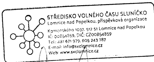
ředitel(ka) příspěvkové organizace