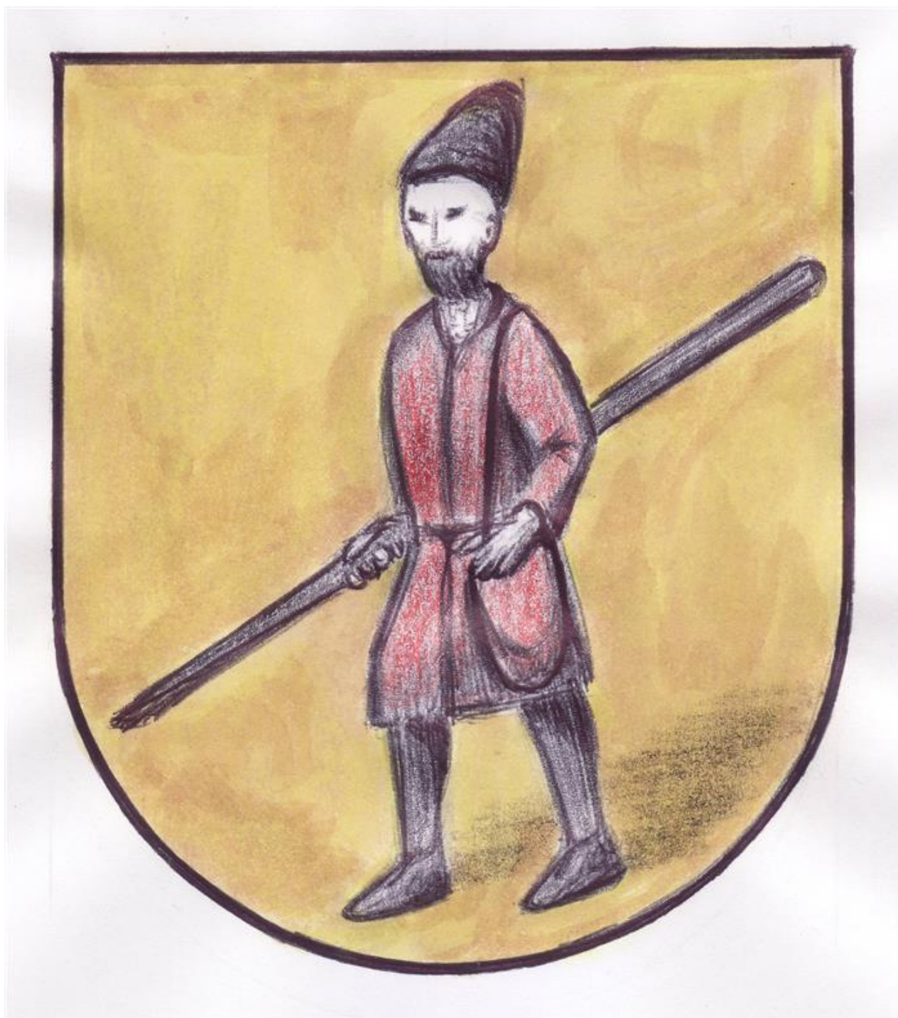
Obrázek Tatarského mužíka (z archivu SVČ Sluníčko – autorka Romana Dlouhá)