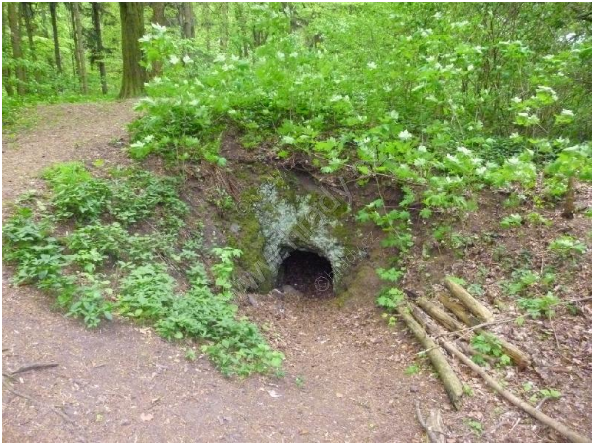
Současnost hradu Kozlov – zřícenina.